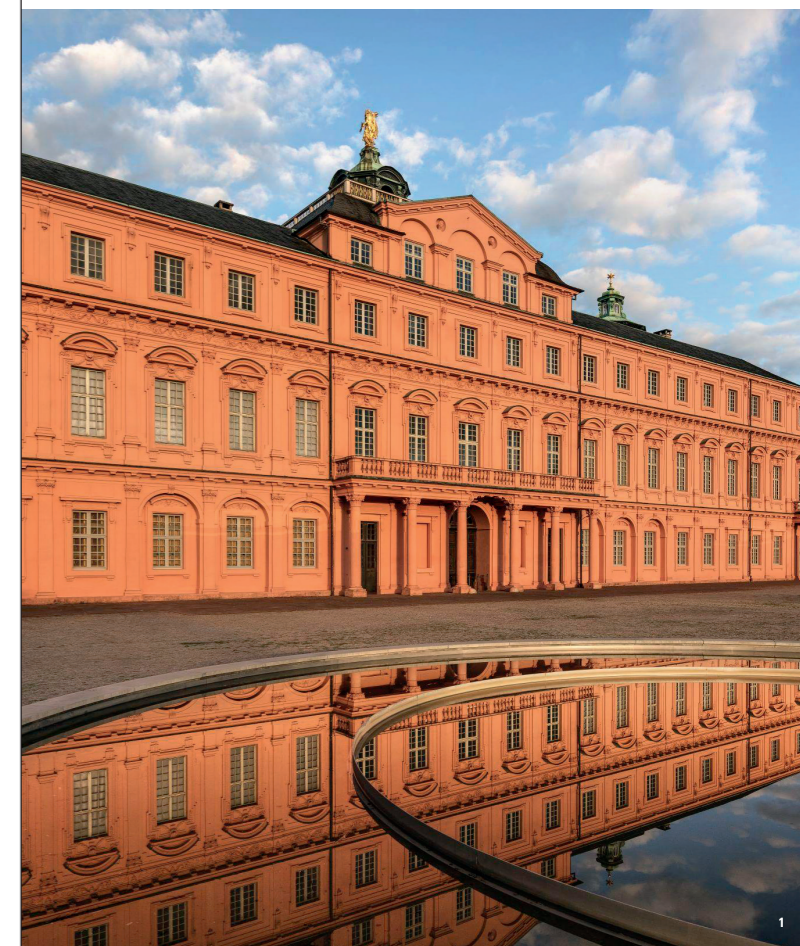
Residenzschloss der Markgrafen von Baden-Baden, Rastatt

Auf den Tag genau jährt sich am 21. Oktober 2021 die Vereinigung der Markgrafschaften Baden-Durlach und Baden-Baden zum 250. Mal.