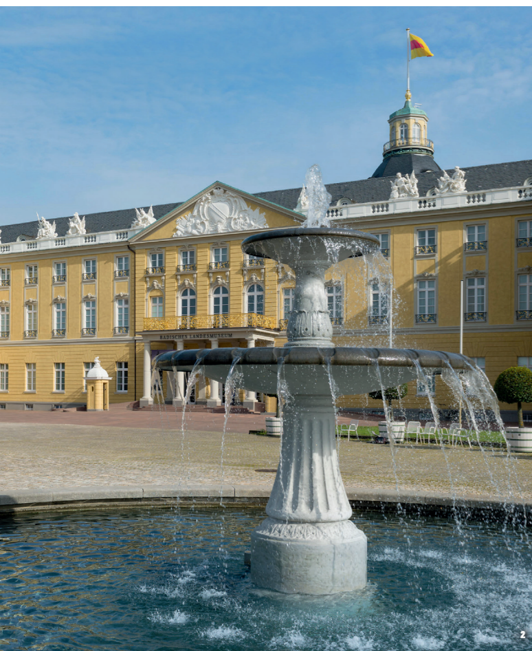
Residenzschloss der Markgrafen von Baden-Durlach und späteren Großherzöge von Baden, Karlsruhe

mächtigen himmlischen Fürsprechern, um in der hergebrachten Konfession geborgen zu bleiben. Die Geschichtsschreibung des 19. Jahrhunderts hat die kaisernahe südliche Markgrafschaft eher als Auslaufmodell beschrieben. Die Rastatter Tagung 2021 gilt den Strukturen von Herrschaft und Kultur im Baden-Badener Teil und ihrem Transfer in ein neues, überkonfessionell gedachtes Fürstentum – im Heiligen Römischen Reich ein Ausnahmefall.